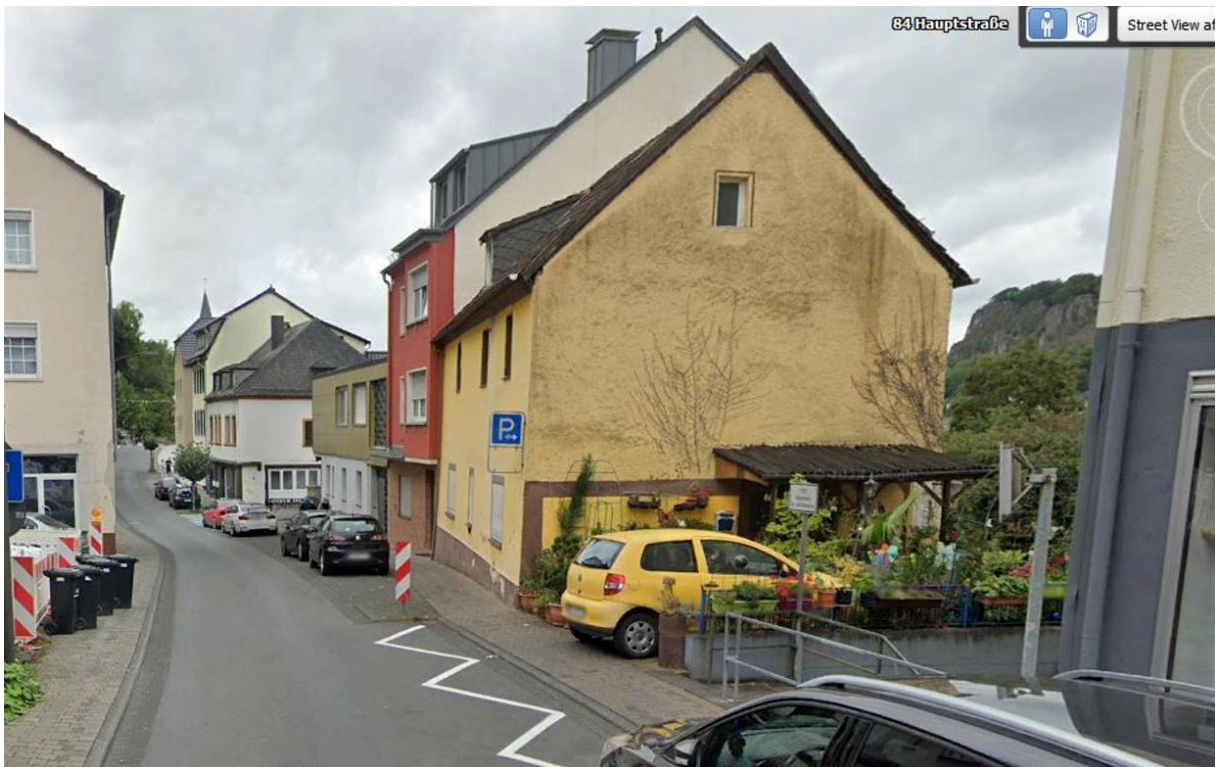
Aus Richtung nr.93 in Richtung nr.70 (Altes Rathaus) (2024)