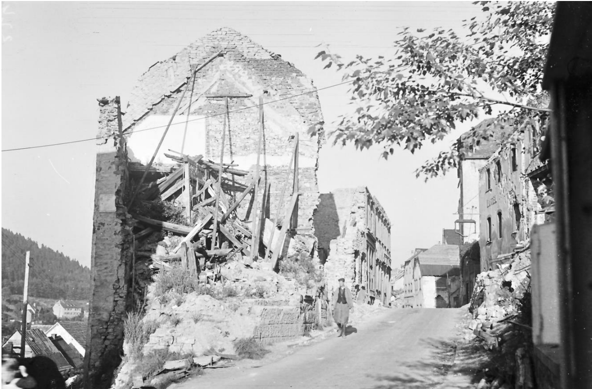
1948: RE: nr.68-Hotel Heck, LI: nr.63-Backer Dehren